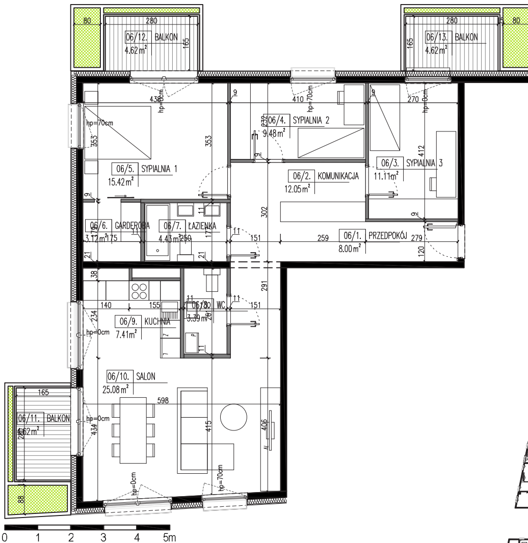
MIESZKANIE B106 – 99.49 m 2